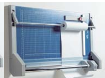
Vægmonteret med rulleholder (ekstratilbehør).